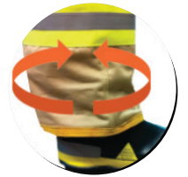
Elástico en pantalones y tobillos