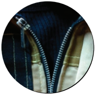
Zipper de escape