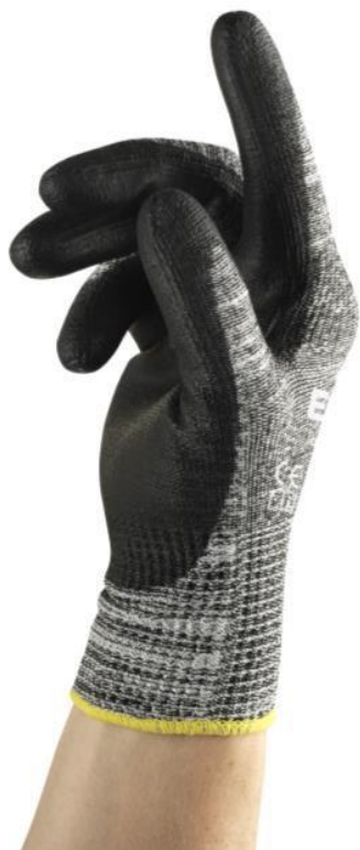
Estilo 48-706 / Terminado arenado