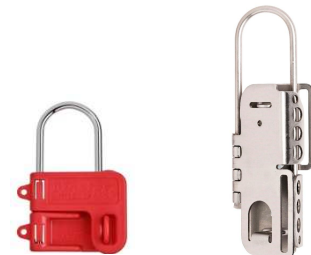
S430 / S431