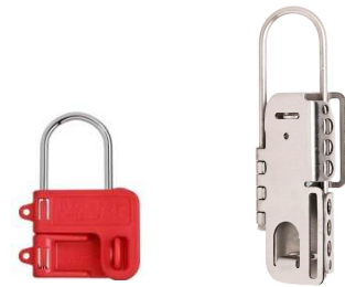
S430 / S431