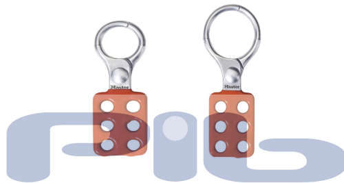
416 / 417