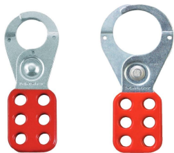
420 / 421