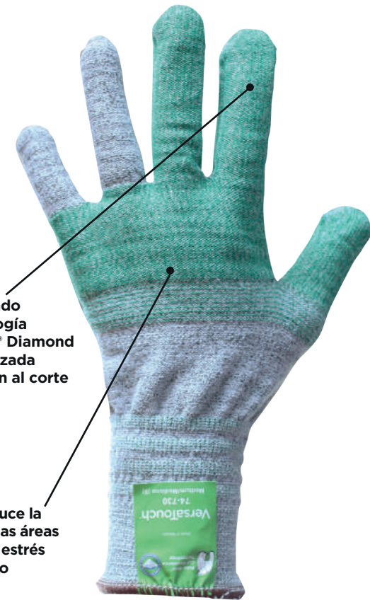
VersaTouch® 74-730 Guante mano libre

KVSD reduce la fatiga en las áreas de mayor estrés de la mano