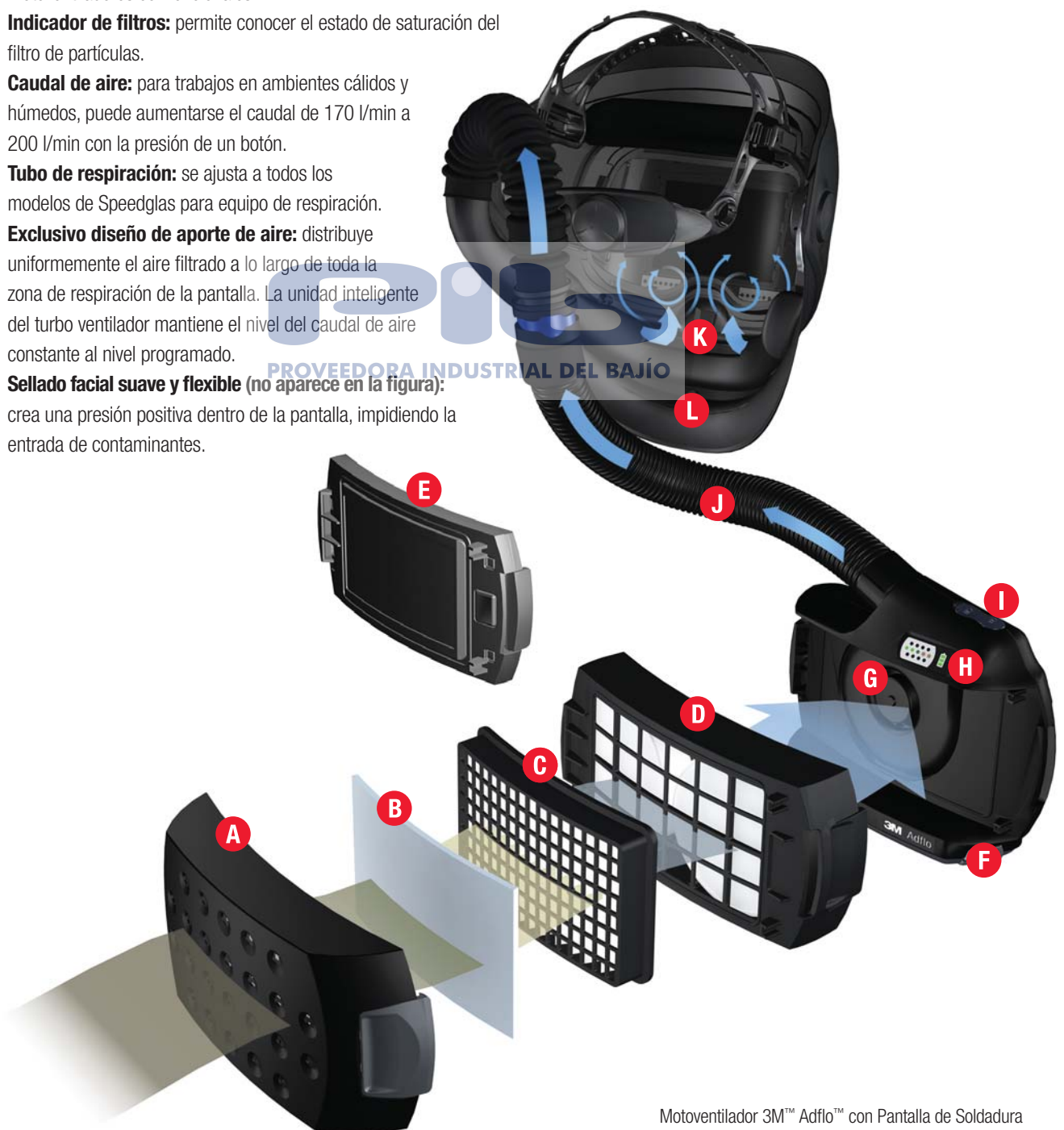
Motoventilador 3M™ Adflo™ con Pantalla de Soldadura 3M™ Speedglas™ 9100 FX Air.