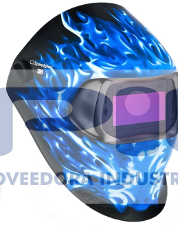
ESTILO ICE HOT