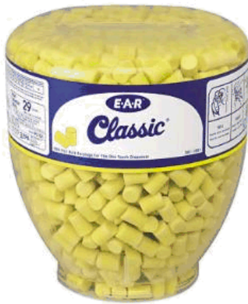
3M™ E-A-R™ Classic™