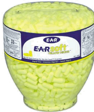
3M™ E-A-Rsoft™ Yellow Neons™